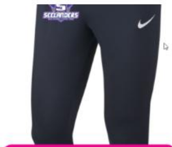
Nike Knit Pants SR